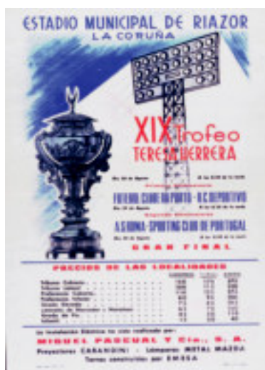
LOS CARTELES DEL TERESA HERRERA HAN CAMBIADO MUCHO CON EL PASO DEL TIEMPO, AL IGUAL QUE EL TORNEO